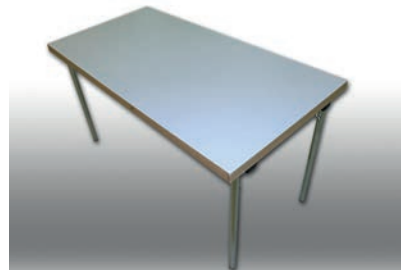
Catering-Tische grau 140 x 170 cm 30 Stück