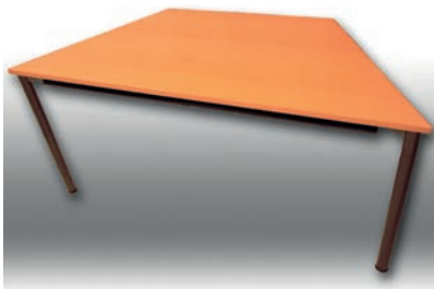
Bene-Tisch Trapez 160/80 x 80 cm 6 Stück