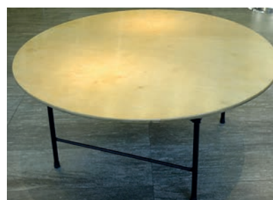
Bankett-Tische Ø 165 cm 30 Stück