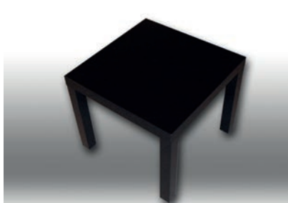
Beistell-Tisch (Holz schwarz) 60 x 60 cm 8 Stück