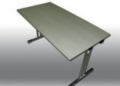
Seminartische T-Fuß 140 x 70 cm 70 Stück