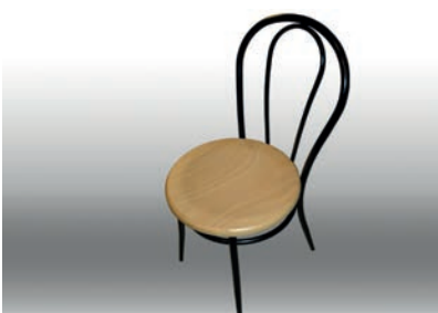
Thonet Sessel Ø 40 cm 40 Stück