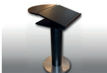
Rednerpult (Holz/schwarz) 62 x 80 x 103 cm 1 Stück