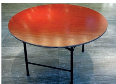
Bankett-Tische Ø 135 cm 10 Stück