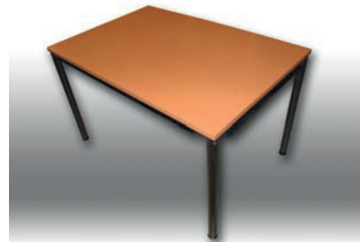
Bene-Tisch 120 x 80 cm 2 Stück