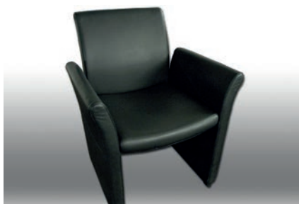
Leder-Fauteuil 16 Stück