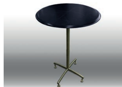
Stehpult (Holz/Stahl) Ø 75 cm / H: 112 cm 26 Stück