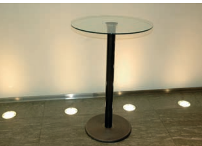
Stehpult (Glas/Stahl) Ø 65 cm 3 Stück