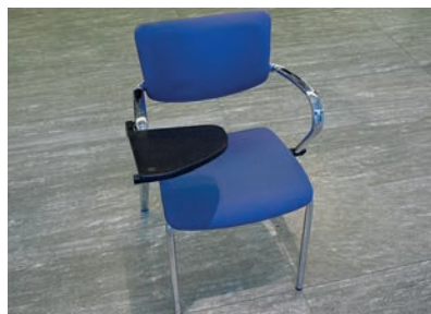
Objekt-Stuhl mit Schreibpult (chrom, Stoff blau) 160 Stück