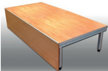
Bühnen-Elemente 100 x 200 cm 10 Stück