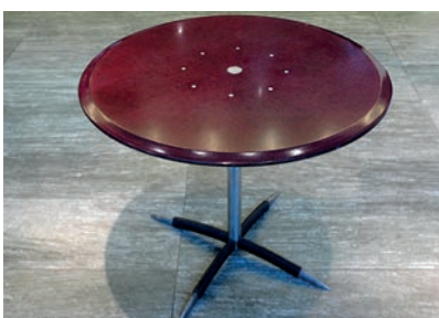
Bistro-Tisch (Holz/Stahl) Ø 90 cm 10 Stück