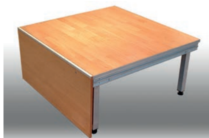
Bühnen-Elemente 100 x 100 cm 2 Stück