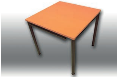
Bene-Tisch 80 x 80 cm 2 Stück