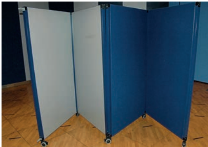
Paravent 100 x 200 cm 16 Stück