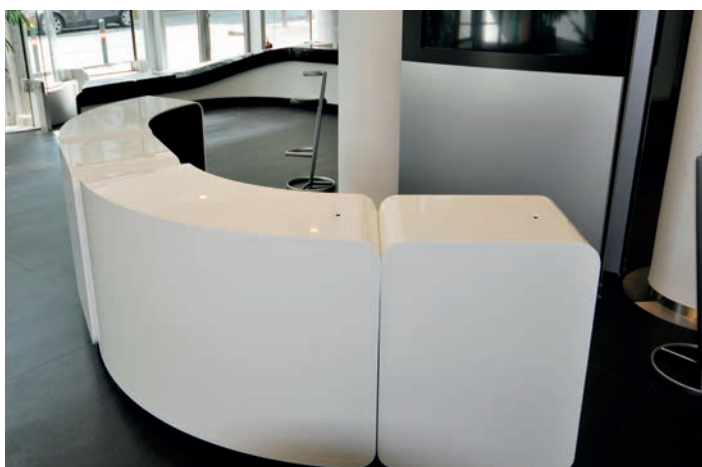
Empfangspult (weiß, Corian) 2 gerade und 2 gebogene Elemente, auch getrennt aufstellbar; Frontfläche gerades Element: B 70 cm x H 90 cm Frontfläche gebogenes Element: B 162 cm x H 90 cm