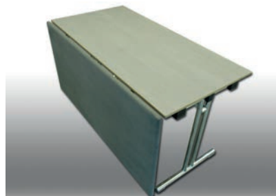
Seminartische T-Fuß mit Verkleidung 140 x 70 cm 20 Stück