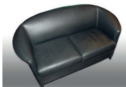
Leder-Couch 2 Stück