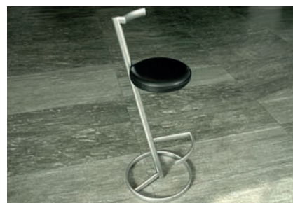
Barhocker (Leder, Stahl) Ø 33 cm 9 Stück