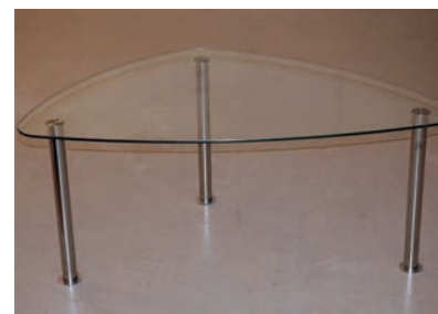
Beistell-Tisch (Glas dreieckig) 117 x 70 cm 2 Stück