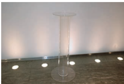
Stehpultsäulen (transparent/Kunststoff) Ø 50 cm 1 Stück H: 113 cm 1 Stück H: 125 cm