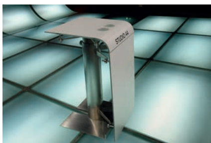
Rednerpult (Kunststoff/Stahl) 70 x 60 x 120 cm 1 Stück