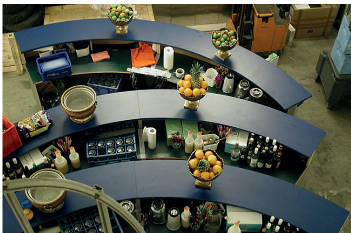
Bar Rund (Holz/blau) Aufstellung in Viertel- oder Halbkreis etc. möglich Ø 500 cm 1 Stück