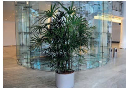
Rhafispalme Ø 100 cm / H: 200 cm 7 Stück