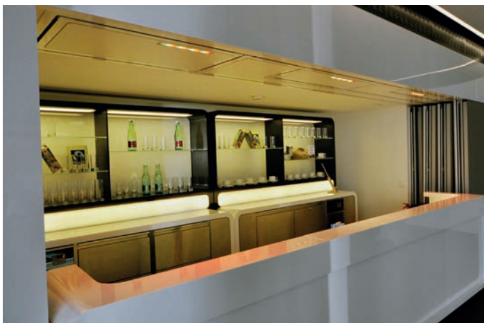
Bar (weiß, Corian) inklusive beleuchtetem Regal- & Kühlblock Gesamtlänge 430 cm 1 Stück