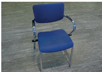
Objekt-Stuhl (chrom, Stoff blau) 320 Stück